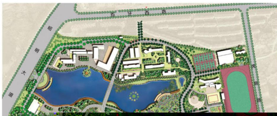
校园总体布局平面图